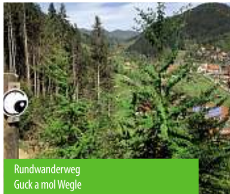
Rundwanderweg Guck a mol Wegle