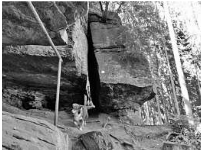
Imposante Felsformationen am Wanderweg bei Zavelstein