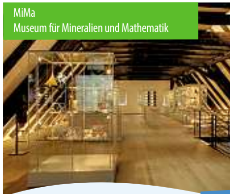
MiMa Museum für Mineralien und Mathematik