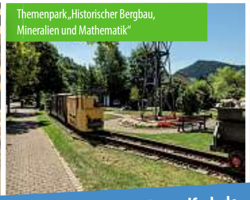
Themenpark „Historischer Bergbau, Mineralien und Mathematik“